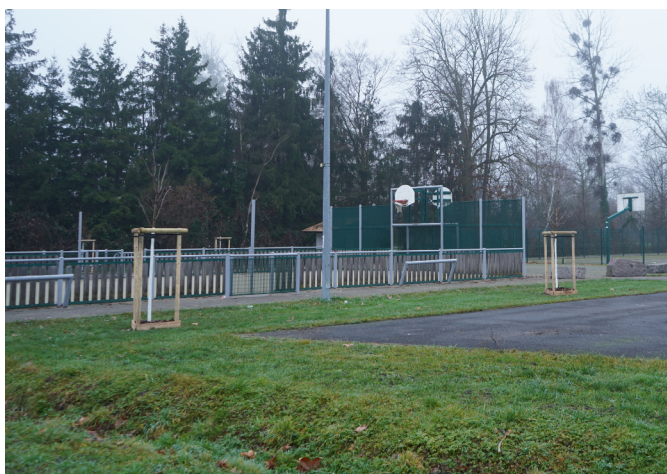
10 plantations aux abords du stade de foot.