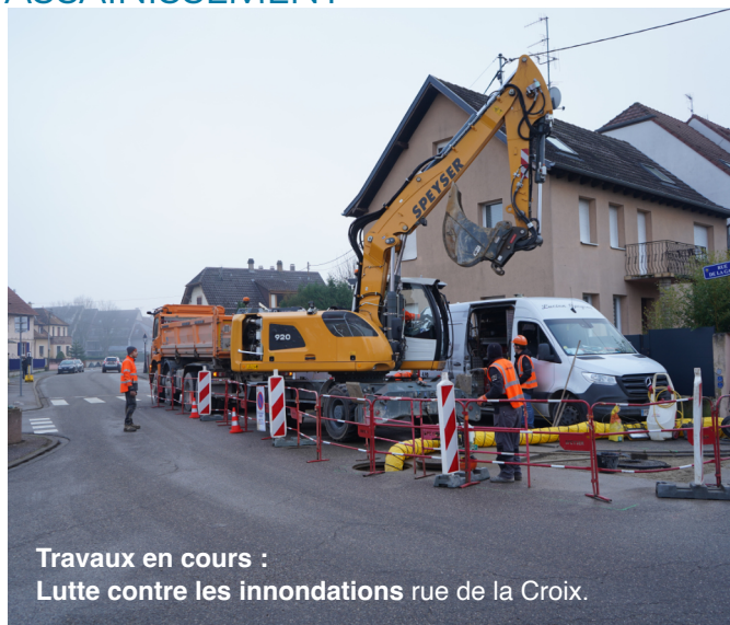
Travaux en cours : Lutte contre les inondations rue de la Croix.