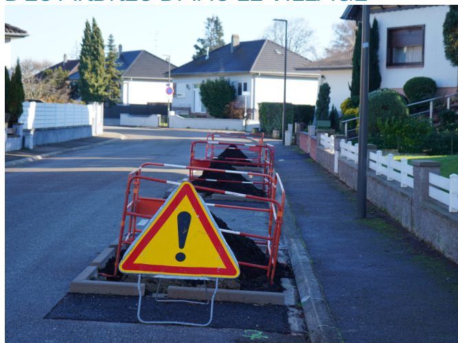
7 plantations rue Mozart.