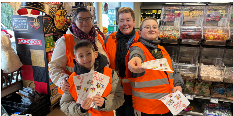
La collecte de la Banque Alimentaire du CMJ au Carrefour Express et ses résultats (460 kg + 141,5 kg par les 2 écoles et le Péri = 601,5 kg pour Lipsheim).