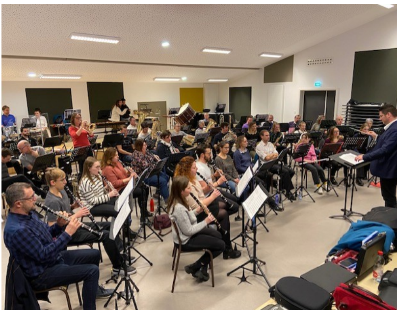
La Vogesla en répétition pour le concert d'hiver qui aura lieu le 25 janvier 2026 à l'ECS.