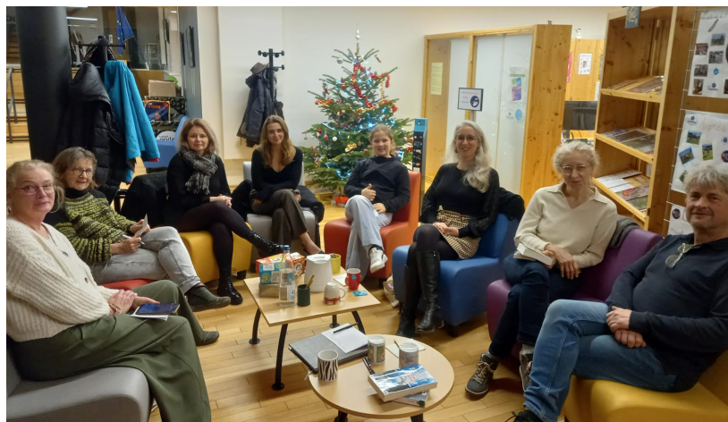
Club lecture du 12 décembre.