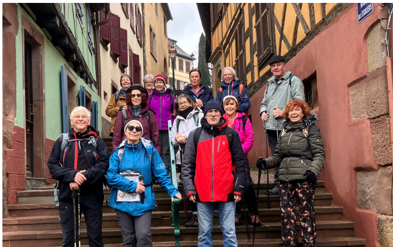
30/11 : sortie Multisports Rando à Wasselonne.