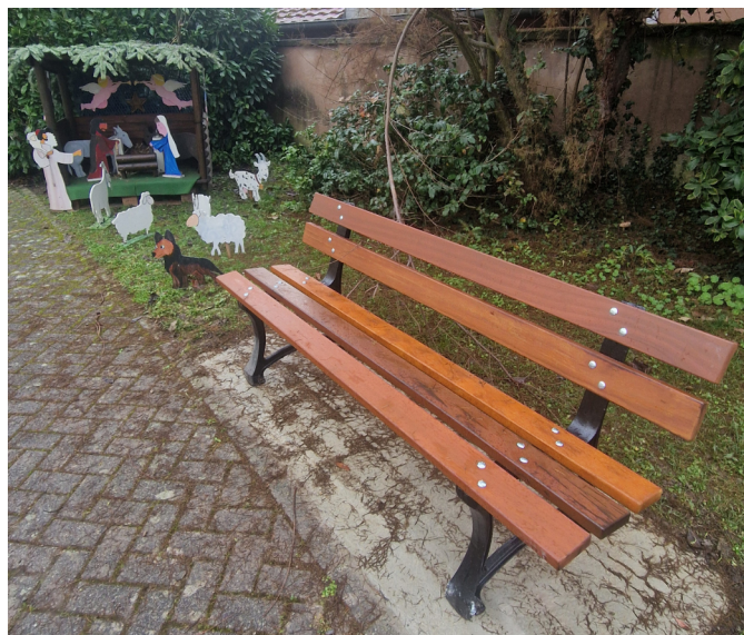
Suite au legs de Céline MULLER, la paroisse a fait l'acquisition d'un banc qui a été installé aux abords de l'église.

Eclairage : plusieurs dysfonctionnements sur le réseau de l'éclairage public rue de la Gare nécessitent de lourds travaux (150 000 €). Un éclairage temporaire a été mis en place afin d'isoler la panne (condamnation de certains candélabres).