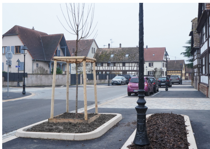
3 plantations rue du Gal de Gaulle.