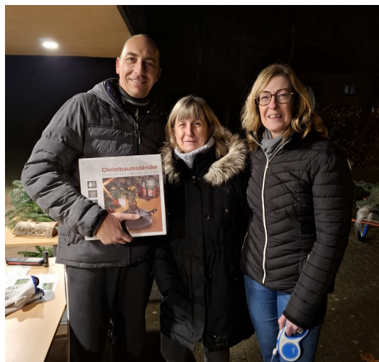
9ème édition de la Distribution des sapins de l' APAL . Toujours un succès et toujours un heureux gagnant au tirage au sort.