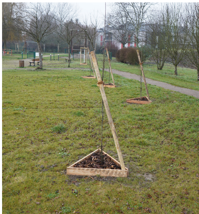
15 plantations d'arbres au Parc de l'Andlau.