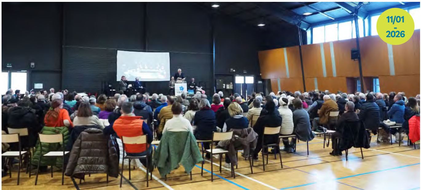
Vœux du maire. René Schaal a annoncé qu'il ne briguera pas un nouveau mandat de maire.