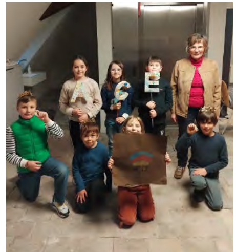
Les enfants de l'ACE fêtent l'Épiphanie. Bravo aux trois rois.