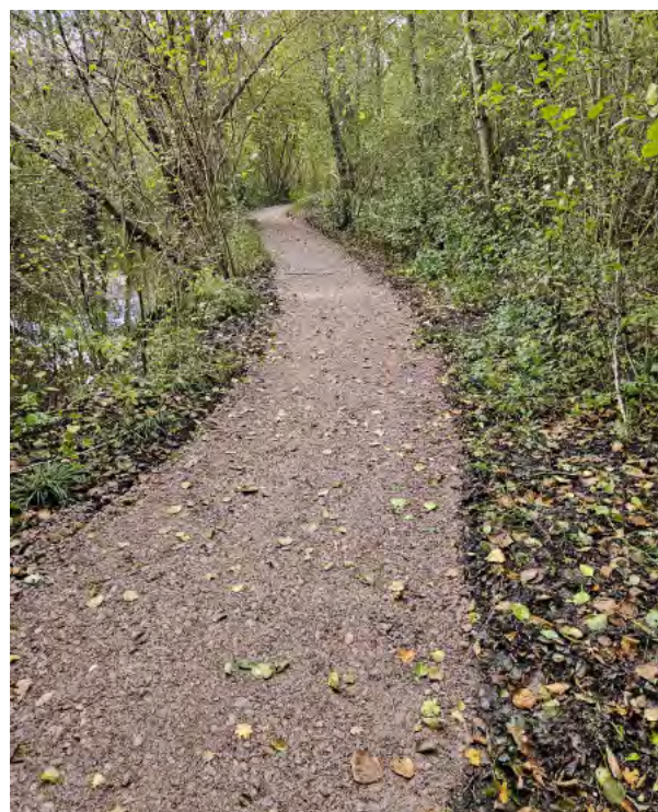
Réfection du chemin de l'Ergelsenbach.

Nous vous rappelons que si la carte électorale n'est pas obligatoire pour voter, la présentation d'une pièce d'identité est obligatoire .