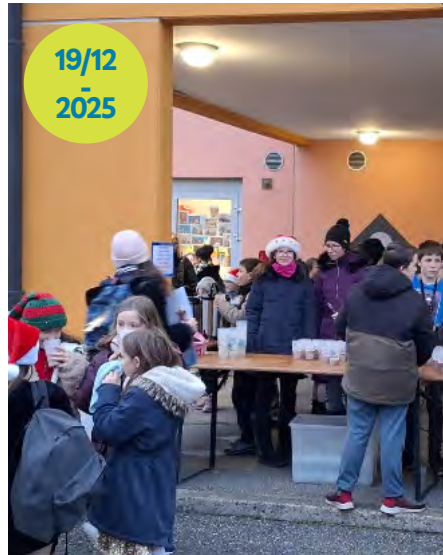
Distribution de chocolat chaud à la sortie de l'école : Bravo aux jeunes du CMJ pour le service des 30 litres de lait offerts par la Ferme Muller.