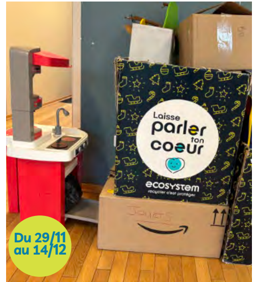
Collecte de jouets CARIJOU : 140 kg récoltés grâce à la collaboration de l'EVS, du périscolaire et de la bibliothèque.