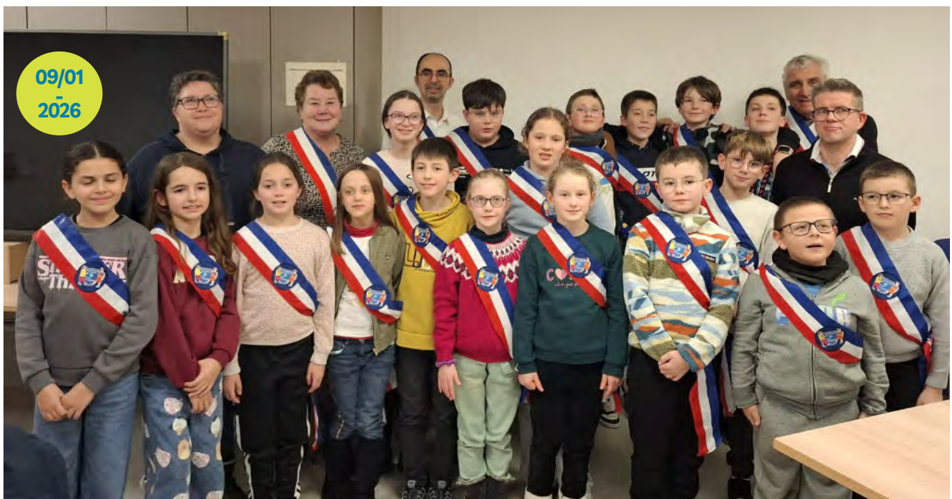
Installation du nouveau CMJ.