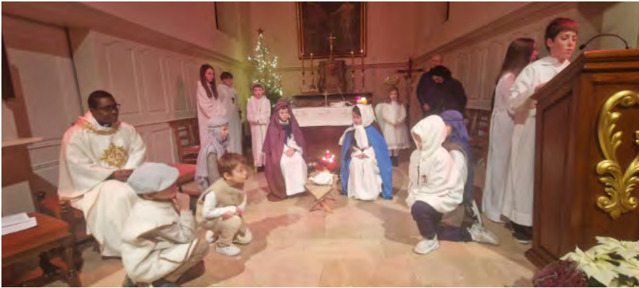
Moment particulièrement émouvant lors de la veillée de Noël : les enfants du catéchisme ont présenté une crèche vivante, rappelant avec simplicité et fraîcheur le mystère de la Nativité.