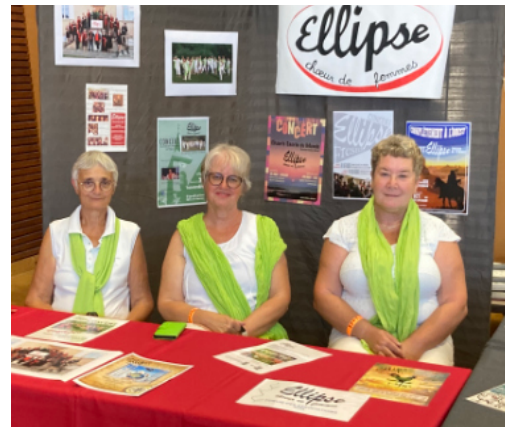
Forum des associations, des démonstrations sportives et la possibilité de découvrir les nombreuses associations actives du village.