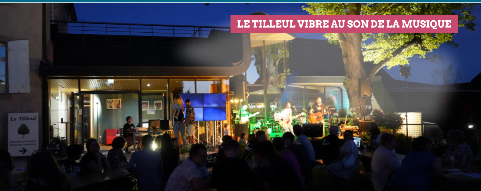
LE TILLEUL VIBRE AU SON DE LA MUSIQUE