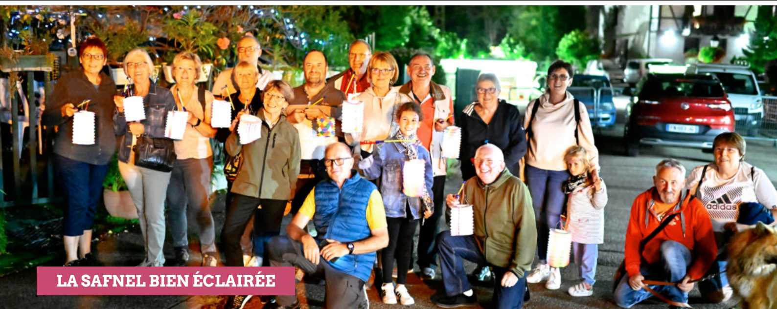
LA SAFNEL BIEN ÉCLAIRÉE