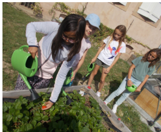
L'équipe de l'accueil périscolaire remercie vivement les habitants du village qui sont intervenus durant l'été pour entretenir le jardin pédagogique. Grâce à eux, début septembre, ils ont retrouvé un jardin en bonne santé et particulièrement productif ! Les petits comme les grands sont ravis de pouvoir récolter les fruits et légumes de leur production.