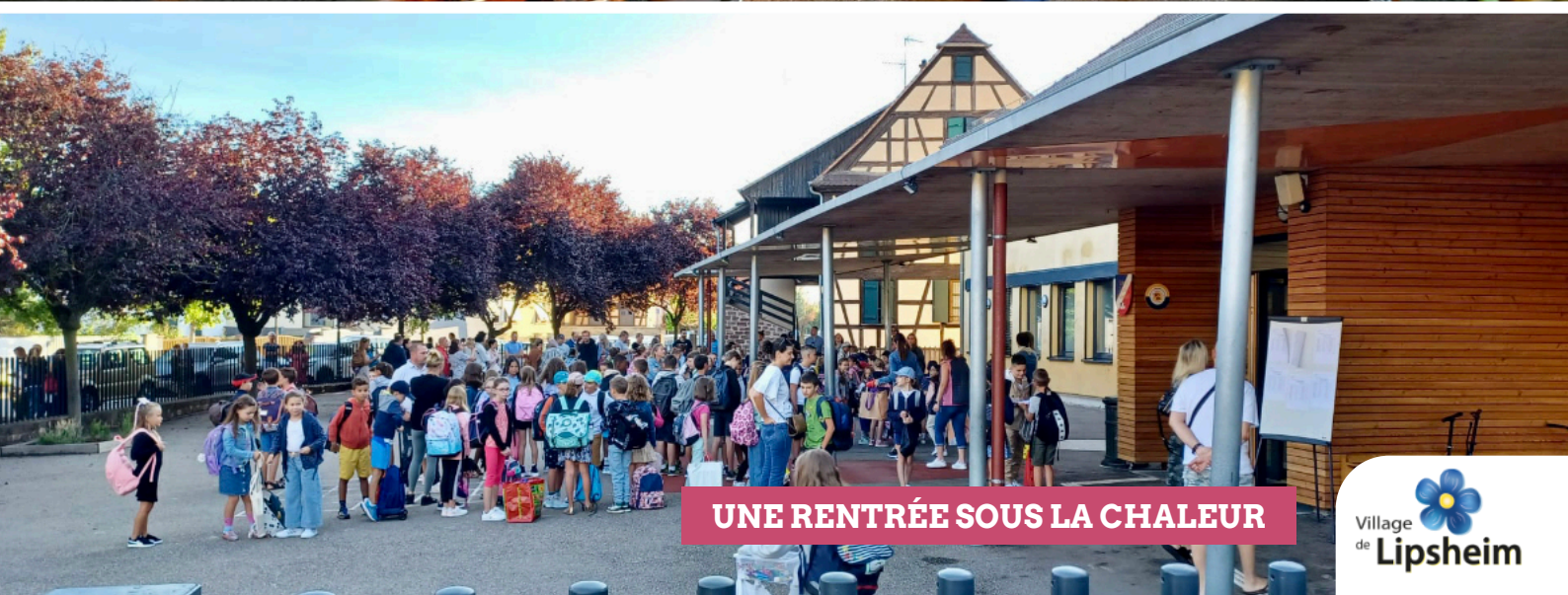
UNE RENTRÉE SOUS LA CHALEUR