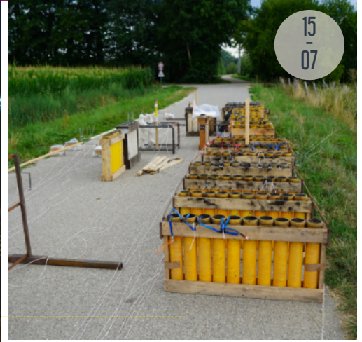
Les préparatifs en coulisse