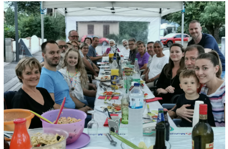
Fête des voisins rue des Châtaignes