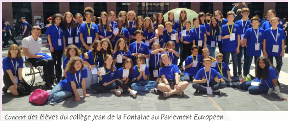
Concert des élèves du collège Jean de la Fontaine au Parlement Européen

Ce concert constitue le premier volet du projet « Fêtons l'Europe ! » initié par la Communauté Européenne d'Alsace pour célébrer les 70 ans au Parlement européen. Le principe est d'associer chaque pays de l'Union européenne avec un établissement alsacien sur deux ans. Le collège Jean de la Fontaine a tout de suite vu l'intérêt de ce projet d'échange européen. Sa candidature a été retenue et il a été associé à l'Autriche, représentée par une délégation de 20 élèves de 6 ème du lycée français de Vienne.