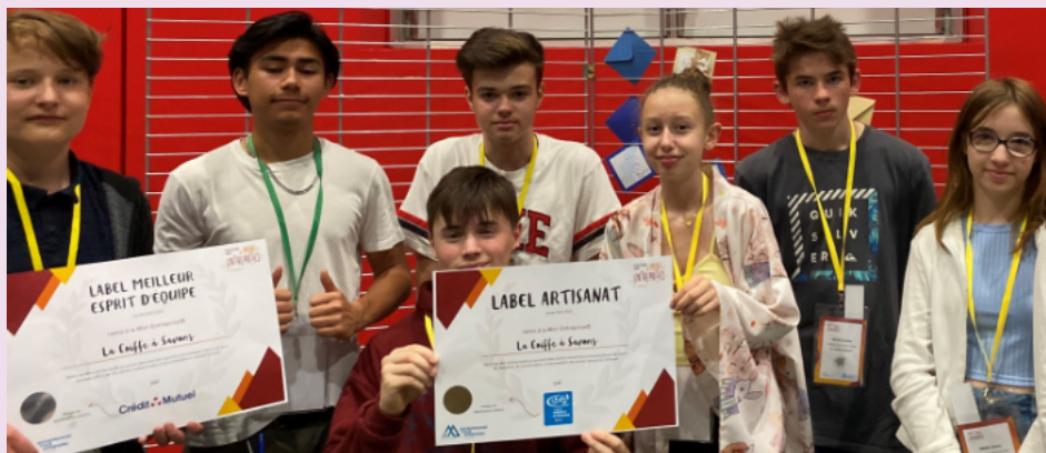
Les élèves du collège J.de la Fontaine ont eu un prix au festival de Colmar pour leur mini-entreprise

Auteur : M. Rouve (professeur d'allemand au collège de Geispolsheim).