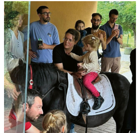
Fête à la crèche des Chérubins