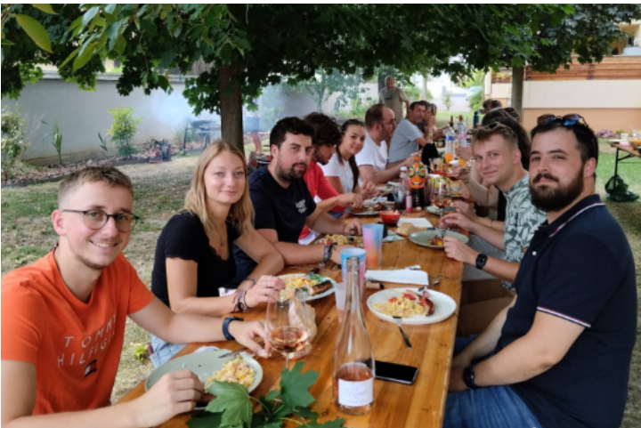
Fête des voisins Résidence Debussy