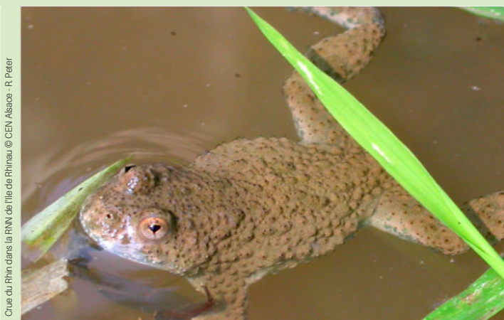
Couée du Rhin dans la RNN de l'île de Rhinau