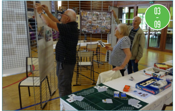
Les vaillants aînés ont participé activement au forum des associations Leur stand a été bien visité et les nombreux jeux ont beaucoup intéressé les visiteurs. Venez les retrouver tous les jeudis après-midi, salle Chopin, même pendant les vacances .