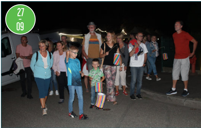
Les arboriculteurs remercient les nombreux participants à la marche aux lampions.