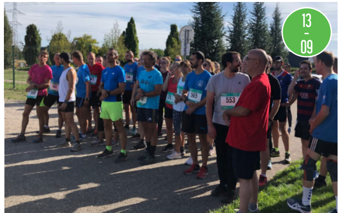
Cross interrégionale des douaniers dans la campagne de Lipsheim.