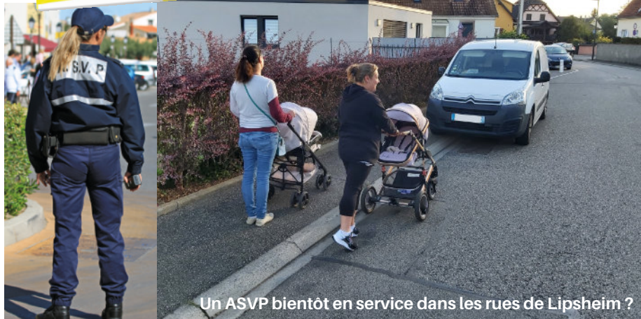
Un ASVP bientôt en service dans les rues de Lipsheim ?